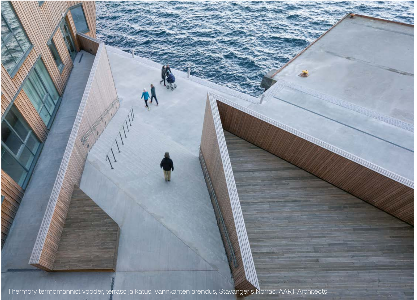
Thermory termomännist vooder, terrass ja katus. Vannkanten arendus, Stavangeris Norras. AART Architects