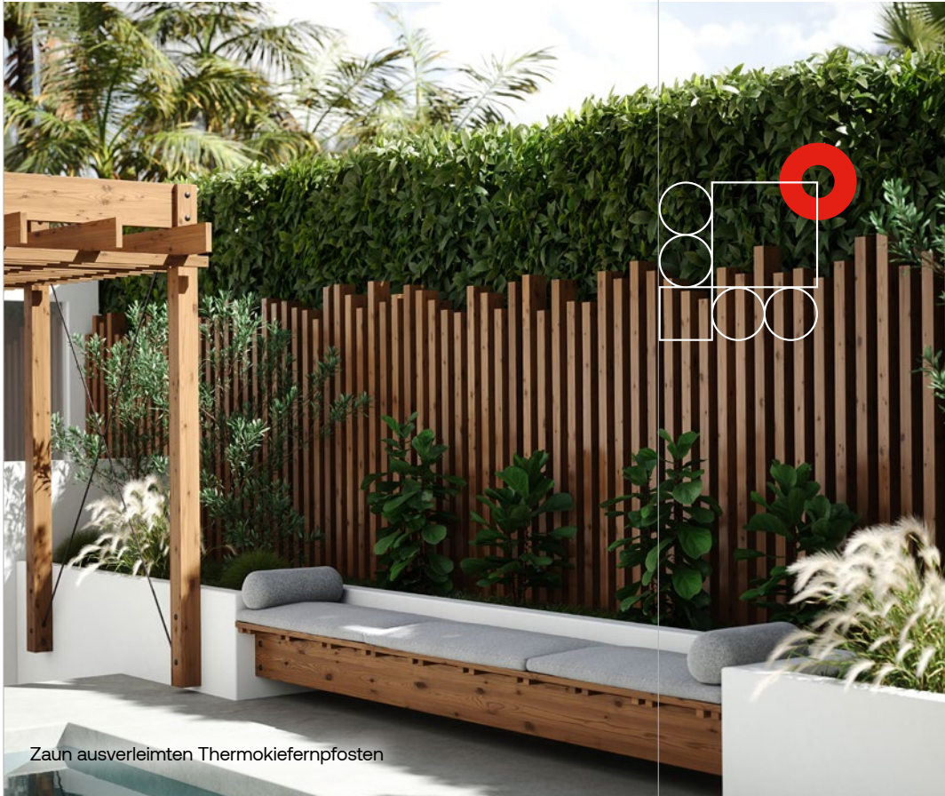
Zaun ausverleimten Thermokiefernspfosten