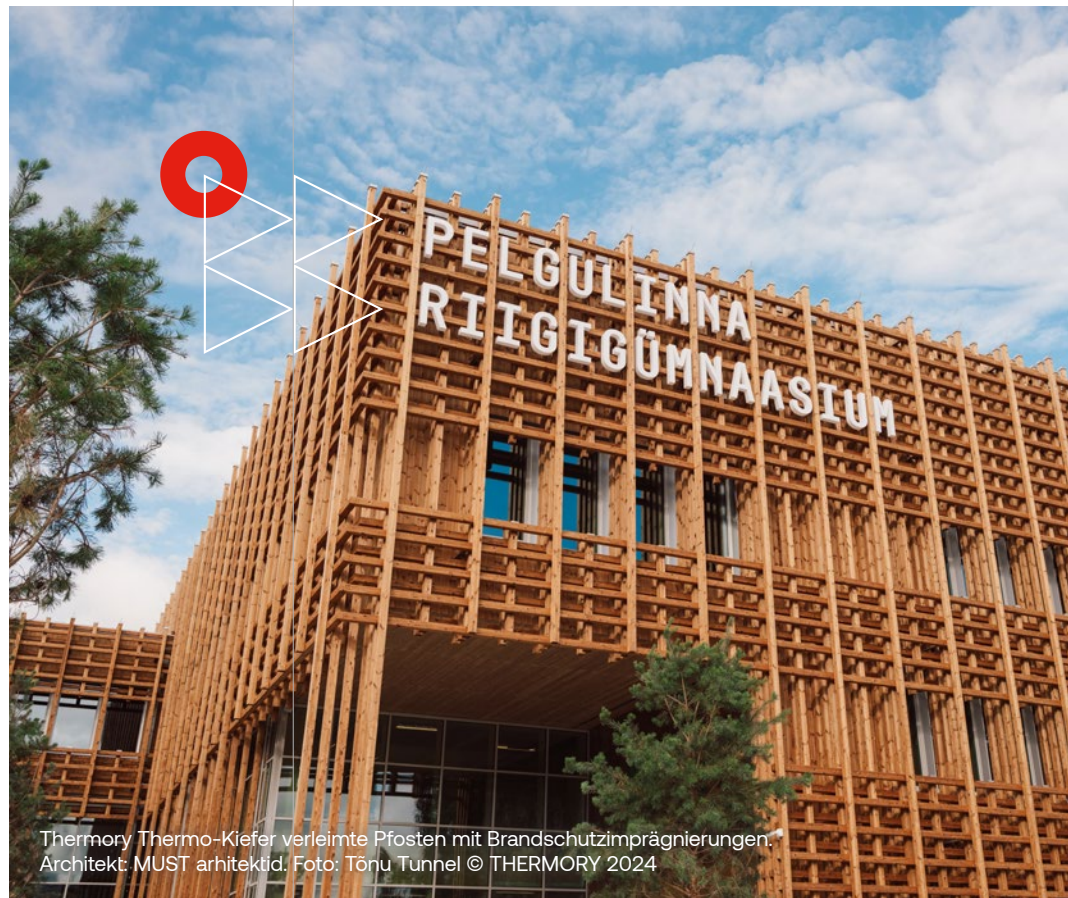
Thermory Thermo-Kiefer verleimte Pfosten mit Brandschutzimprägnierungen. Architekt: MUST arhitektid. Foto: Tõnu Tunnel © THERMORY 2024