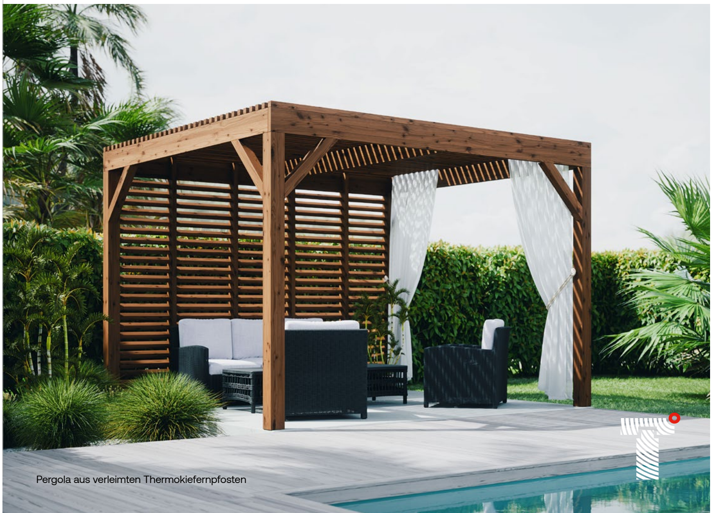
Pergola aus verleimten Thermokiefernpfosten