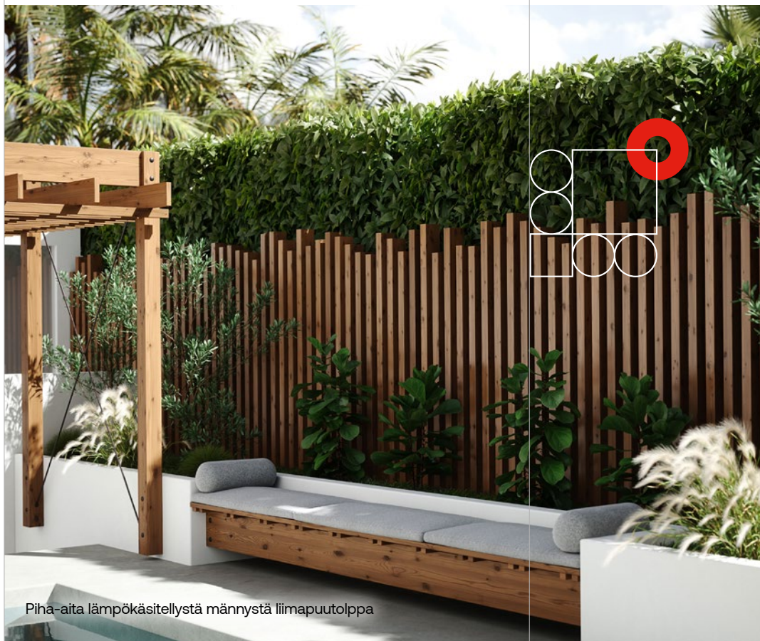
Piha-aita lämpökäsitellystä männystä liimapuutolppa