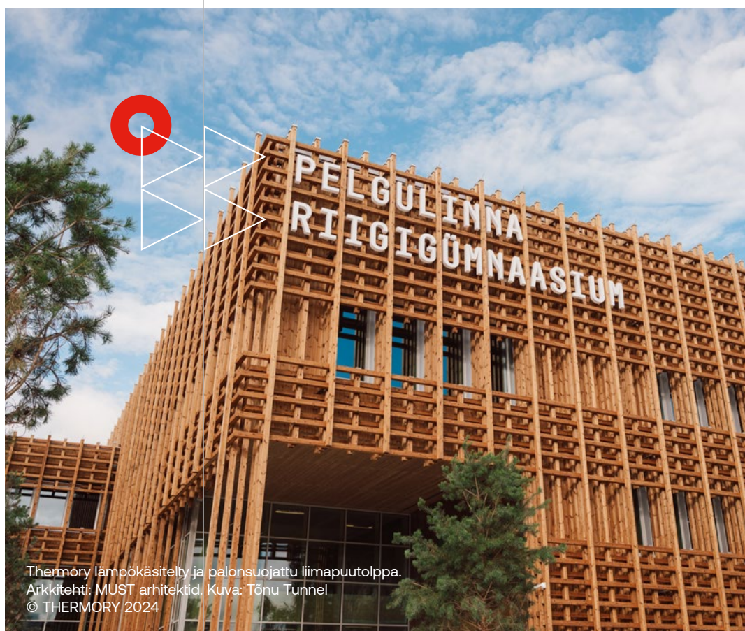
Thermory lämpökäsitely ja palonsuojattu liimapuutolppa. Arkkitehti: MUST arhitektid.