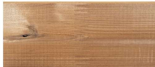
Liimapuutolppa lämpökäsitellystä männystä, 130 x 130 mm